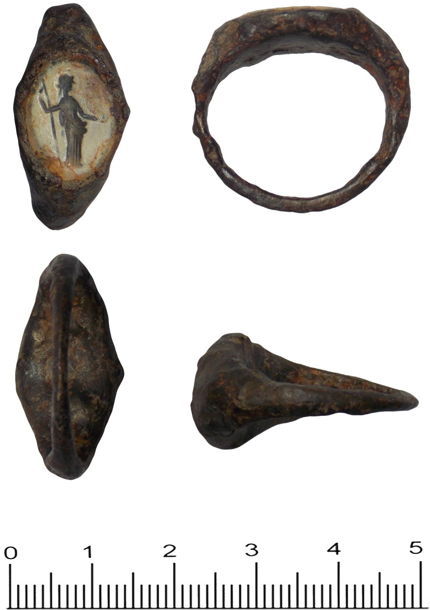
Fig. 2b. Images of the iron gem ring that has the representation of Ceres.