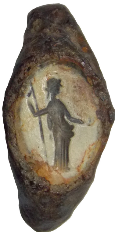
Fig. 2a. Image of the iron gem ring that has the representation of Ceres.