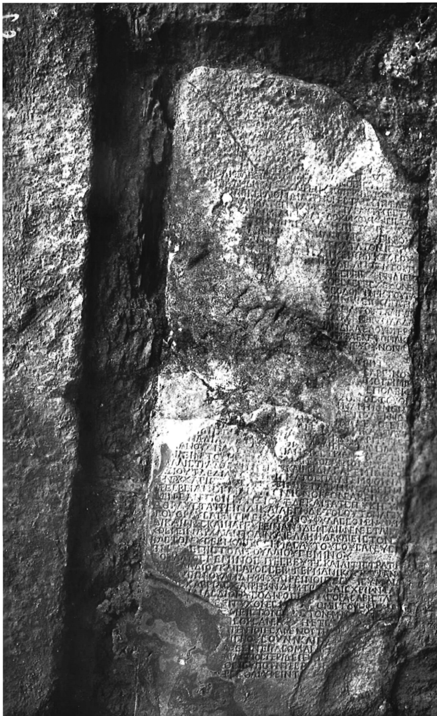
Fig. 4. Inscripția ISM I 67 (A) încadrată în zid.