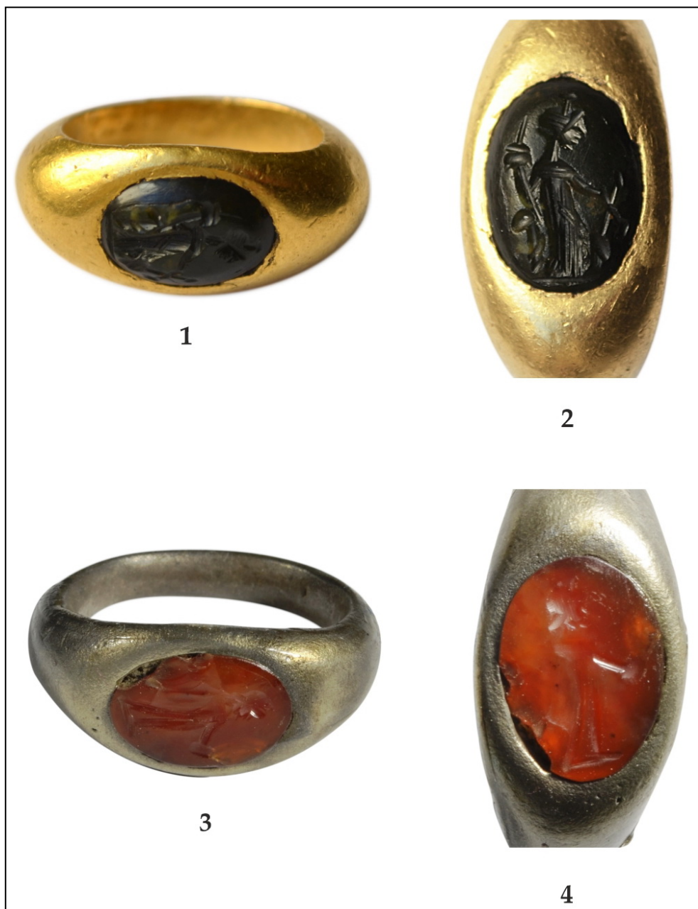
Pl. I. 1. Inelul de aur de la Copșa Mică (mărit); 2. Gema de onix negru de pe inelul de la Copșa Mică (mărită); 3. Inelul de argint de lângă Orlat (mărit); 4. Gema de jaspis roșcat de pe inelul de lângă Orlat (mărită). Pl. I. 1. The golden ring from Copșa Mică (enlarged); 2. The black onyx gem on the ring from Copșa Mică (enlarged); 3. The silver ring next to Orlat (enlarged); 4. The reddish jaspis gem on the ring next to Orlat (enlarged).