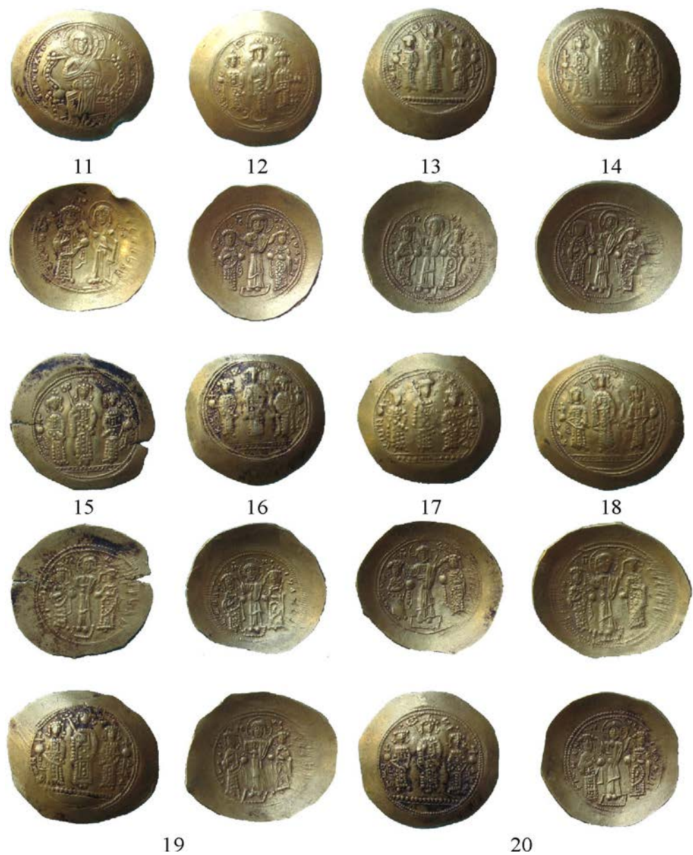
Pl. 4. Monede de aur bizantine din tezaurul descoperit la Kalipetrovo. Pl. 4. Byzantine gold coins from the hoard discovered at Kalipetrovo.