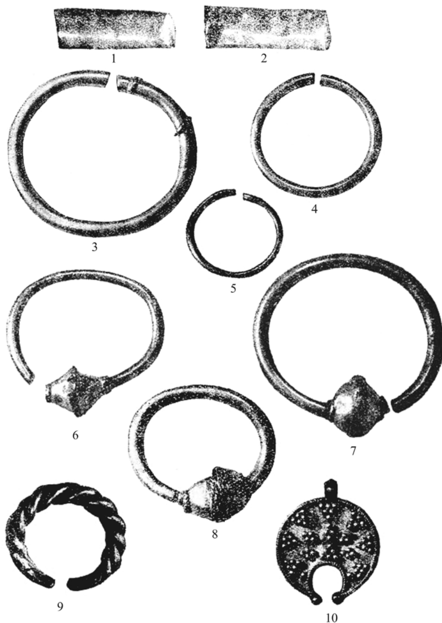
Pl. 2. 1-2. Fragmente de bară de aur; 3. Verigă de cercei; 4-5. Verigi de păr; 6-8. Cercei; 9. Inel din sârme torsionate; 10. Pandantiv lunulă (fără scară; după Severeanu 1931).

Pl. 2. 1-2. Gold bar fragments; 3. Earring link; 4-5. Hair links; 6-8. Earrings; 9. Twisted wire ring; 10. Moon pendant (without scale; according to Severeanu 1931).