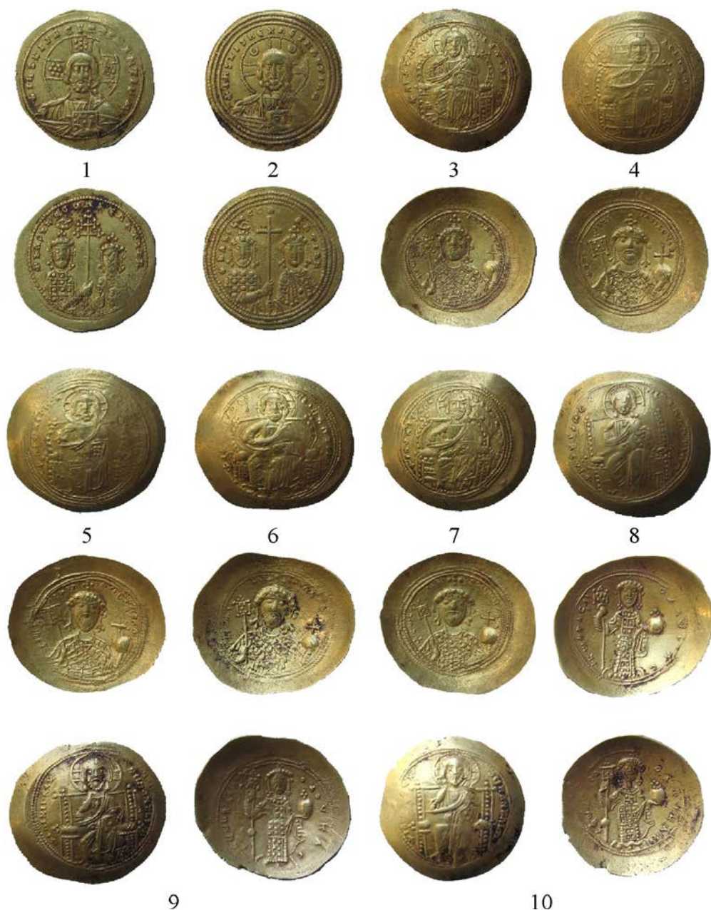
Pl. 3. Monede de aur bizantine din tezaurul descoperit la Kalipetrovo. Pl. 3. Byzantine gold coins from the hoard discovered at Kalipetrovo.