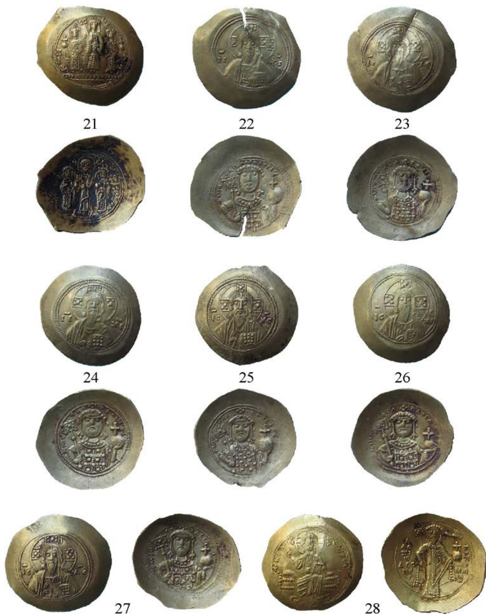
Pl. 5. Monede de aur bizantine din tezaurul descoperit la Kalipetrovo. Pl. 5. Byzantine gold coins from the hoard discovered at Kalipetrovo.