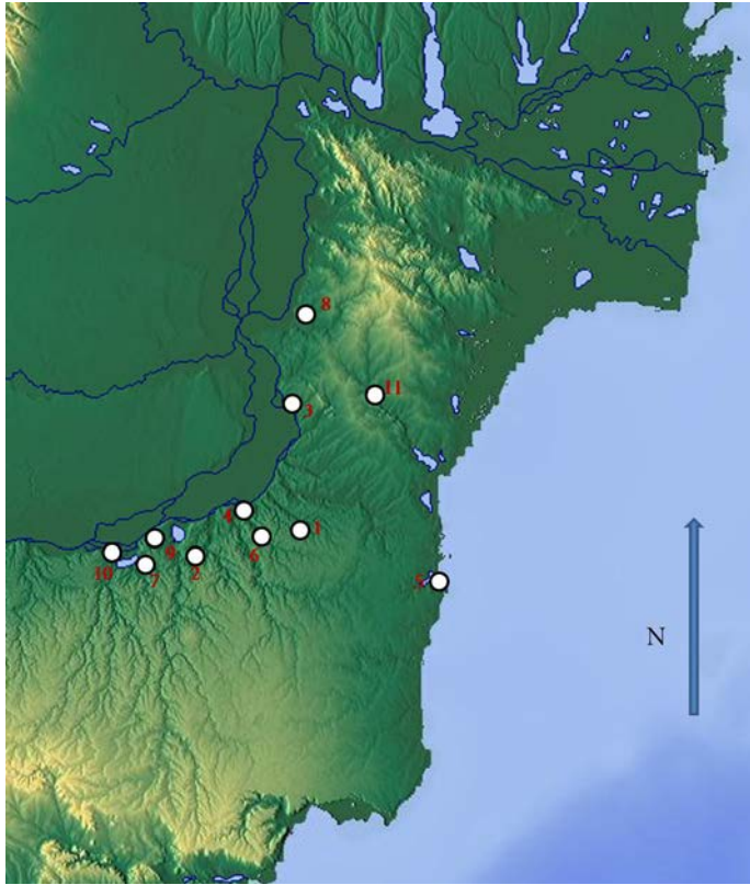
Fig. 2. Descoperiri izolate de monede geto-dacice din tipul „Inotești-Răcoasa” în Dobrogea (1 Abrud; 2 Băneasa; 3 Capidava; 4 Dunăreni; 5 Eforie Sud; 6 Floriile; 7 Galița; 8 Gârliciu; 9 Izvoarele; 10 Ostrov; 11 Pantelimonu de Sus).