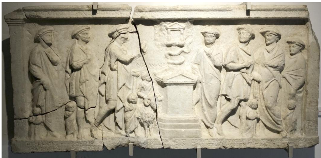
Fig. 1. IGBulg V 5103.

sous le 1 er stratège : Εὐμαχος Μέμνονος sous le 2 ème stratège : Χαίρων Χορείου sous le 3 ème stratège : [Δεινομένης Ἡροτείμου]. [reconstitué] sous l'autel : [Ἡ]ρότειμος [Ἡ]ροτείμου sous le 4 ème stratège : Πυθάγγελος Ἐπικράτεος sous le 5 ème stratège : Κράτων Ἀριστονεΐκου sous le 6 ème stratège : Πολύξενος Μελσέωνος sous le secrétaire : γραμματεὺς Ἀπολλόδωρος Πανσα[νία].