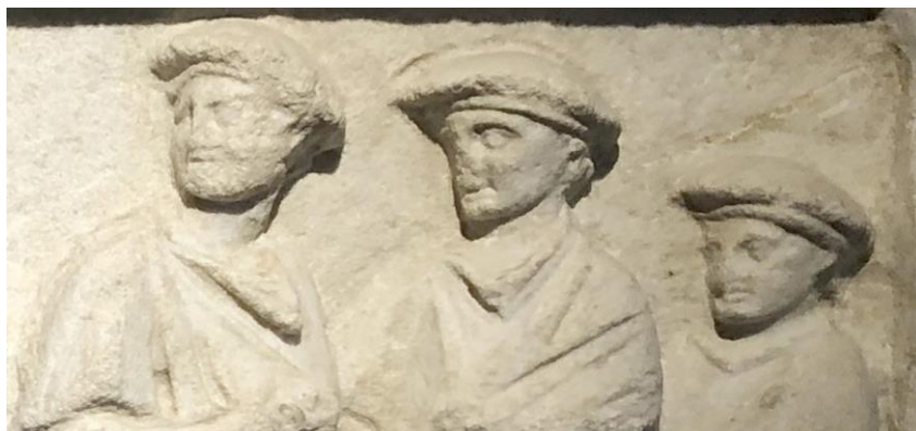
Fig. 3. Portraits des trois stratèges, détail.

Les sept stratèges sont représentés en costume militaire macédonien, avec la kausia sur la tête, la chlamyde attachée par une agrafe sur l'épaule droite et la krépide visible sur le troisième personnage en partant de la gauche, celui qui se trouve à côté du sarcophage. La kausia est portée par Alexandre le Grand lors de sa campagne en Asie, selon une description d'Ephippos d'Olynthe 43 . Le même type de béret est également porté par Antimachos, frère de Démétrios, roi de Bactriane qui envahit l'Inde en 184 av. J.-C. 44 , et caractérise l'armée macédonienne. Contrairement au stratège, les enfants sont représentés en himation couvrant entièrement leur corps, le bras droit ramené sur la poitrine, selon un type de présentation courant dans l'iconographie grecque.