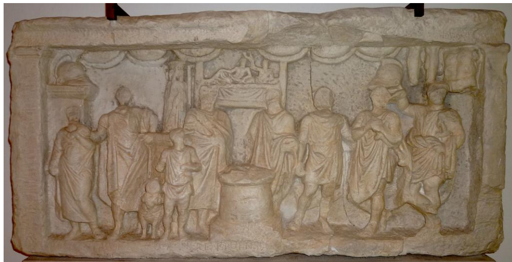
Fig. 4. IGBulg V 5102.

rendus sans patronyme (voir Nikandros). Sous les corniches, une panoplie de six boucliers et, dans l'angle supérieur droit, une paire de cnémides et une cuirasse. Au centre de la scène, sous le bord supérieur, dans un cadre rectangulaire, se trouve la scène du banquet héroïque, avec deux figures masculines sur la kliné , celle de droite avec le bras droit levé tenant un rhyton. Les insignes militaires sont complétés par deux casques. Un élément de plus est la présence d'un Hekataion placé sur une base haute. La déesse à trois visages entourant une colonne centrale apporte un complément d'information. La présence d'une telle statue indique le lieu de la cérémonie ainsi que son caractère. Les statues d'Hécate étaient érigées dans les lieux de passage, publics ou funéraires.