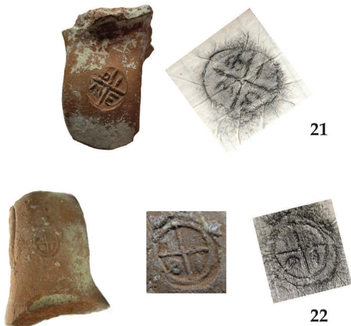
Fig. 4. Amathonte. Amphores d'Akanthos : palais (21) ; abords sud-ouest de l'Agora (22).