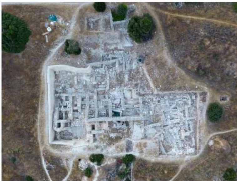
Fig. 1b. Vue aérienne des magasins à vivre du palais d'Amathonte (Efa).