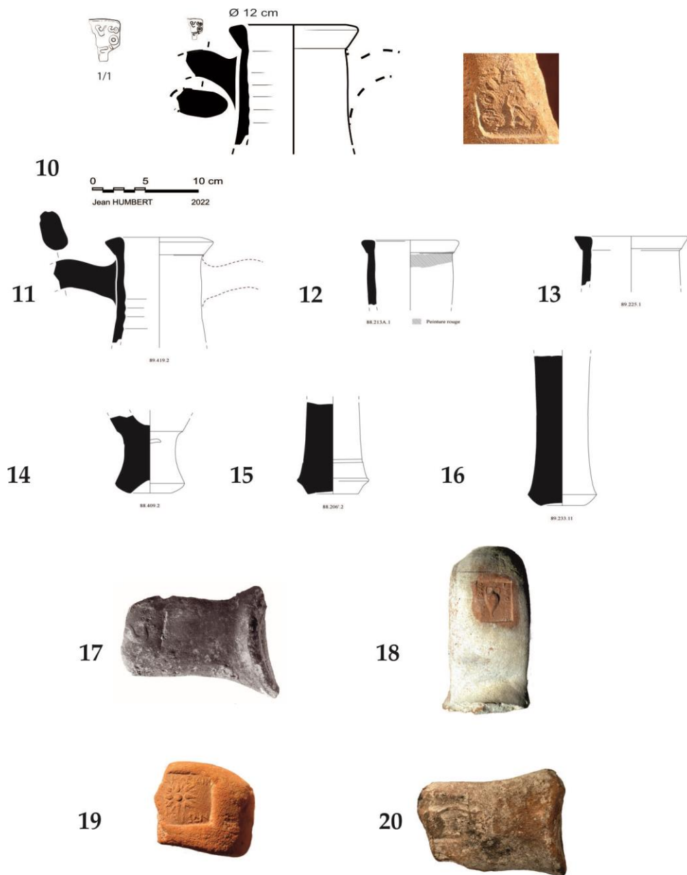
Fig. 3. Amathonte. Amphores de Thasos : palais (10–19) ; abords Sud-Ouest de l'Agora (20).