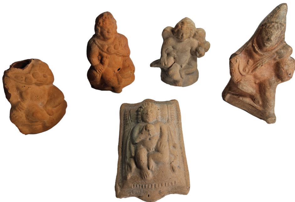
Fig. 2. Piesele încadrate în această tipologie, descoperite la Tomis.