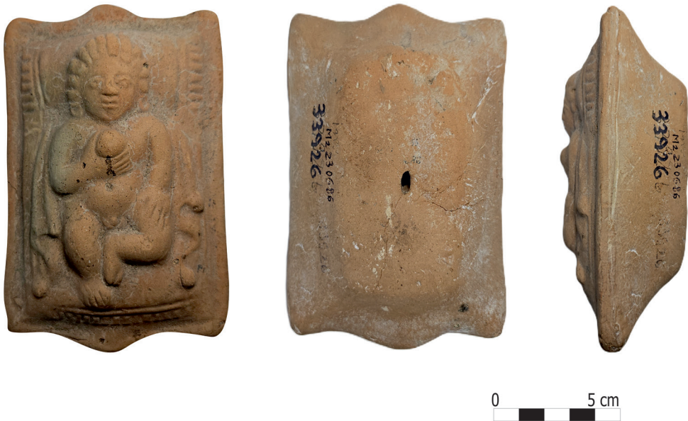
Fig. 7. Piesa cu număr de catalog 3.