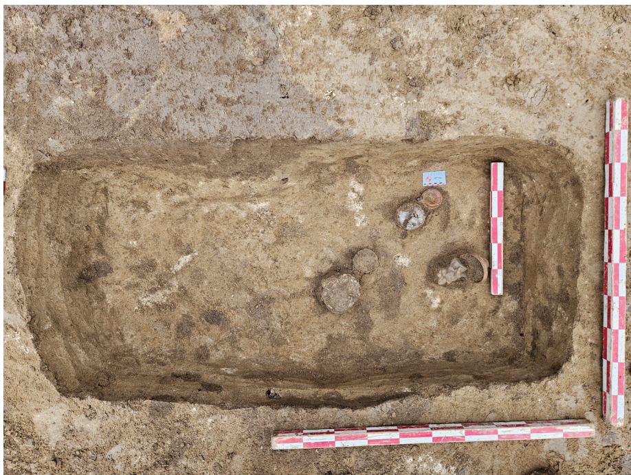
Fig. 10. Contextul de descoperire al piesei cu număr de catalog 5.