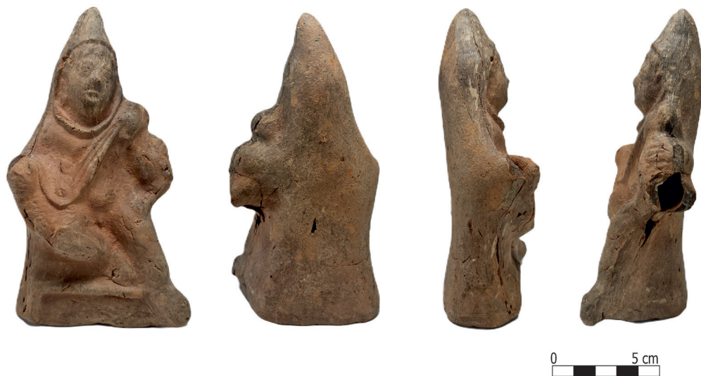
Fig. 8. Piesa cu număr de catalog 4.