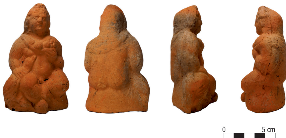
Fig. 4. Piesa cu număr de catalog 2.