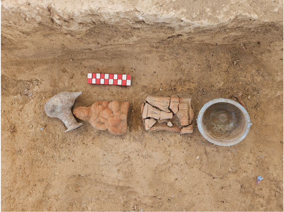
Fig. 6. Contextul de descoperire al piesei cu număr de catalog 2, detaliu.