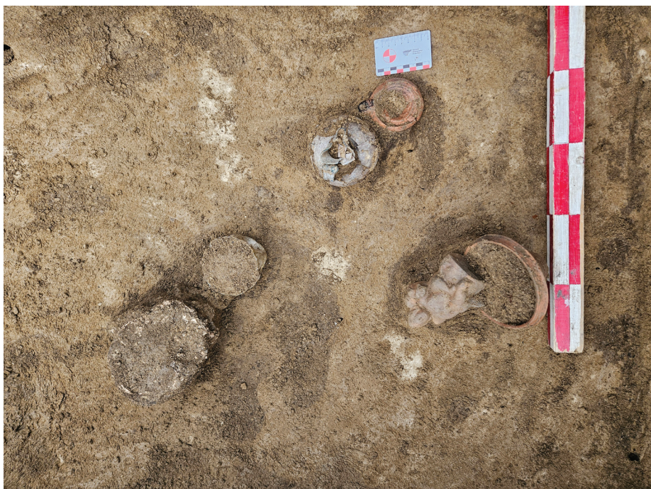
Fig. 11. Contextul de descoperire al piesei cu număr de catalog 5.