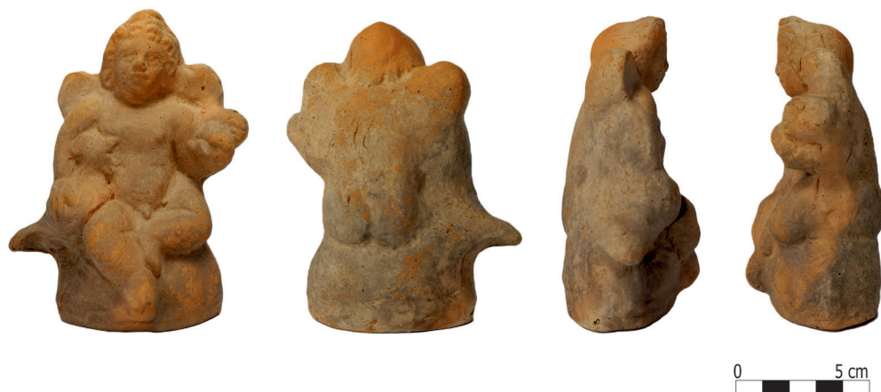
Fig. 9. Piesa cu număr de catalog 5.