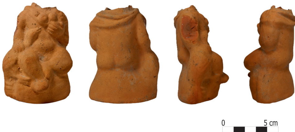
Fig. 3. Piesa cu număr de catalog 1.