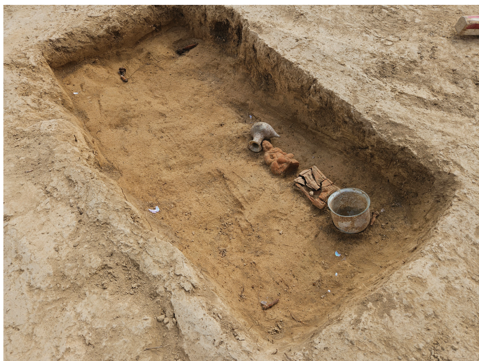
Fig. 5. Contextul de descoperire al piesei cu număr de catalog 2.