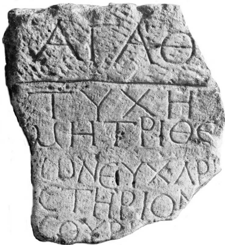
Fig. 1 - Inscripție închinată Mamei Zeilor descoperită în localitatea Mihail Kogălniceanu (jud. Constanța).