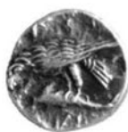
Pl. II - Noi descoperiri preromane în Dobrogea. New pre-Roman discoveries in Dobruja.