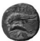
Pl. I - Noi descoperiri preromane în Dobrogea. New pre-Roman discoveries in Dobruja.