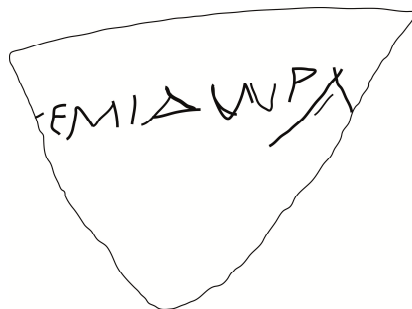
Fig. 3. Fac-similé du premier graffite de Tyras.

La paléographie est intéressante et confirme la date hellénistique, en particulier la forme du delta , alors que la dernière lettre fut gravée plus grande que les autres ; la date est corroborée par la désinence koinè du nom théophore d'une grande banalité de la femme.