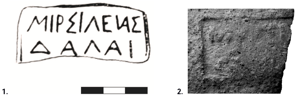
Fig. 2 - Alte toarte ștampilate cu numele Δαδας: desen (după IRIMIA 1973), fotografie (Muzeul de Istorie și Cultură al Crimeei Orientale, Kerč).