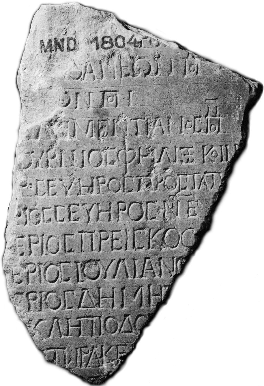
Fig. 2 - Inscription ISM II 27.