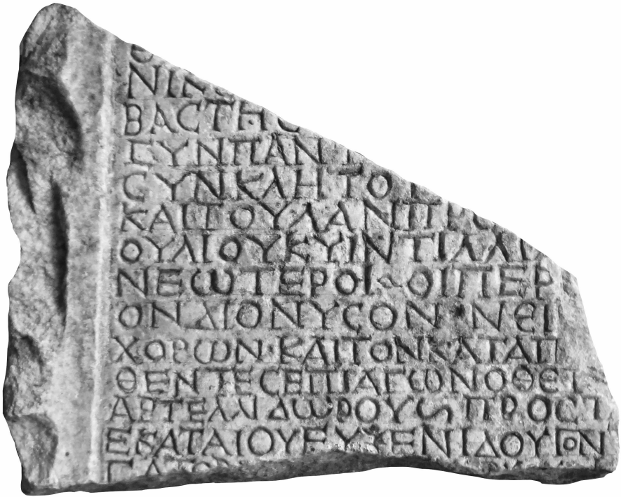
Fig. 3 - Inscription d'Histria (AVRAM 2018, fig. 1).