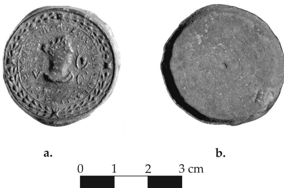
Fig. 1 – Capsulă de teriac descoperită la Vâlcele (Inv. 83349).