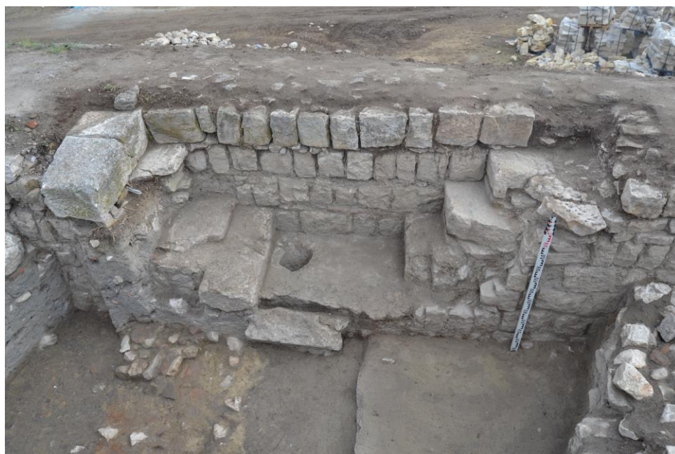
Fig. 5. Treptele de acces pe curtina C.;