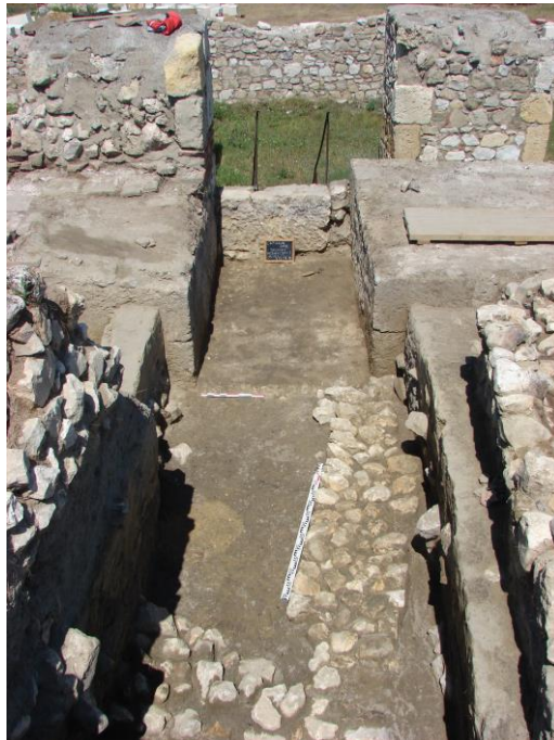
Fig. 3. Sondajul efectuat pe intrarea în turnul 1. Pragul de intrare original datat în sec. IV p. Chr.;