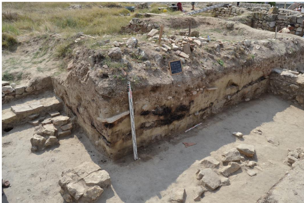
Fig. 4. Interior camera C1 (curtina C). Nivelul de distrugere datat în a doua jumătate a sec. VI p. Chr.;