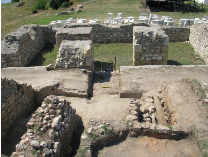
Fig. 2. Nivelul de intrare în turnul 1 (sec. VI p. Chr.).