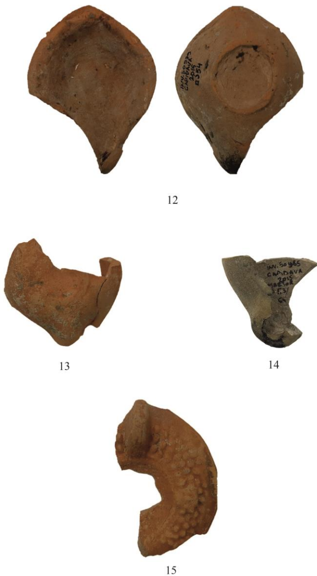
Fig. 10. Opaite nr. 12 – 15. (Nr. 12 - Dimensiuni: L = 8,6 cm; l = 6,5 cm; Db = 3,2 cm; Nr. 13 - Dimensiuni: L = 5,9 cm ; l = 6,3 cm; Db = 2,5 cm; H păstrată = 2,5 cm; Nr. 14 - Dimensiuni: L = 5 cm; Nr. 15 - Dimensiuni: L = 6 cm).