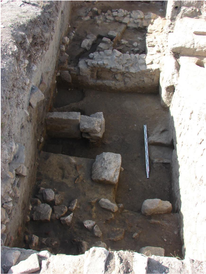
Fig. 6. Canalul de evacuare a apei (curtina C).;