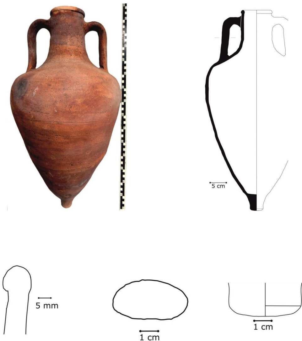
Fig. 3 - L'amphore inv. 45985.