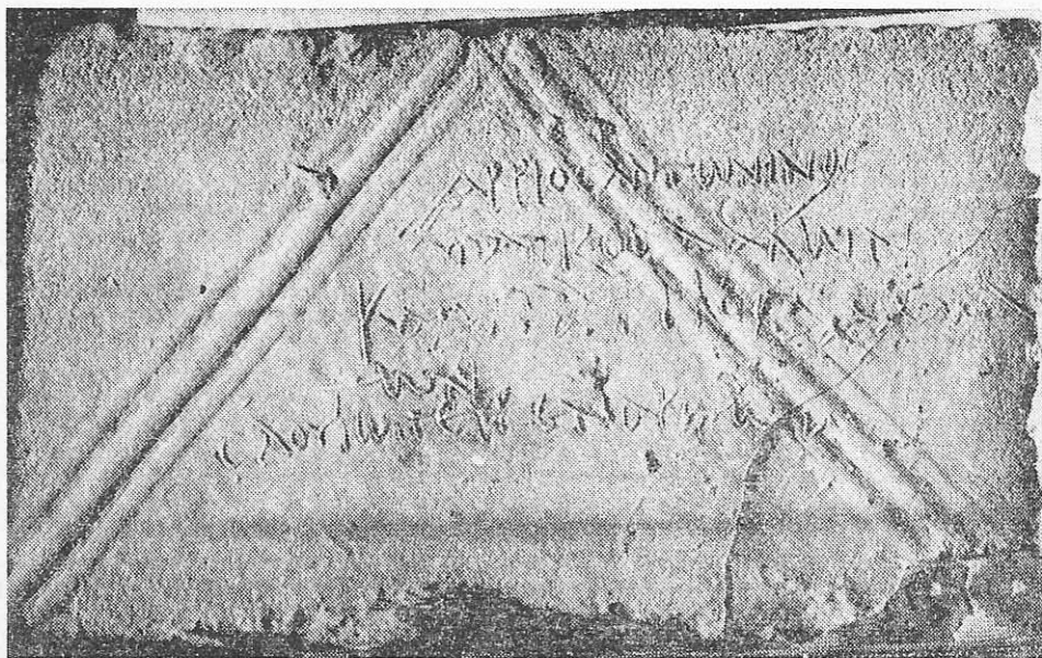
Fig. 1. ROMULA-MALVA — Cărămidă cu inscripție grecească. Muzeul din Caracal.