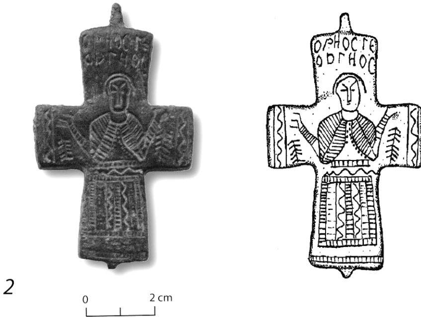
Fig. 2 – 1. Croix reliquaire à cassette; 2. Croix pectorale reliquaire avec Saint Georges.