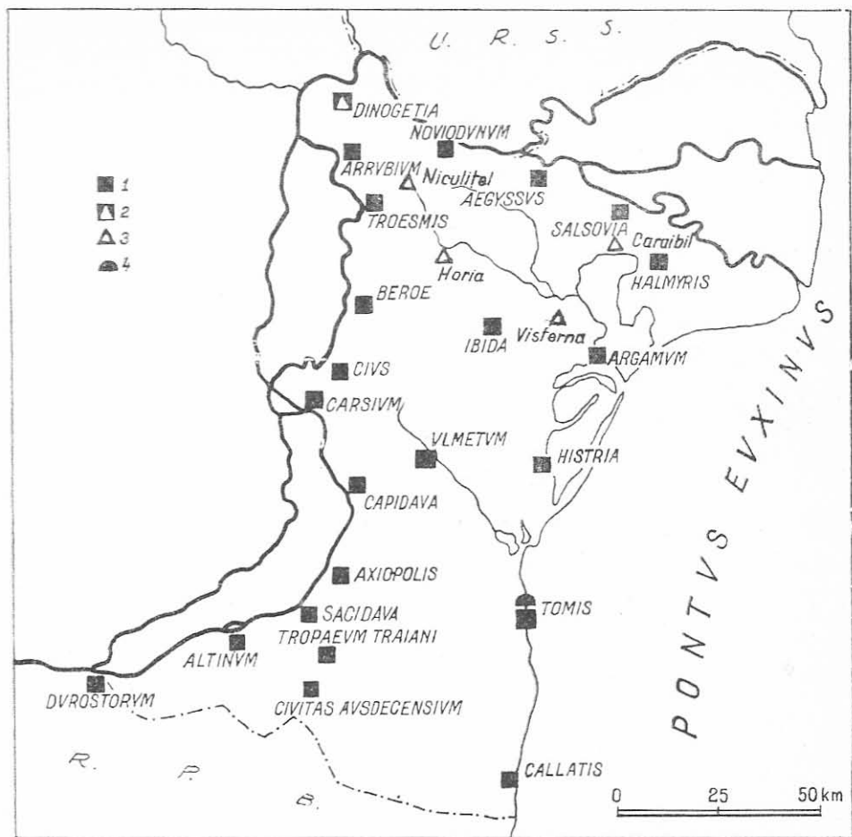
Fig. 1. Dobrogea romană în secolul al III-lea. 1. Cetate romană. 2. Cetate romană în care s-au găsit fragmente ceramice carpice. 3. Așezări sau necropole în care a fost descoperită ceramică de tip carpic. 4. Necropolă romană în care au fost descoperite morminte sarmatice.

Gh. Bichir avînd în vedere descoperirile de la Dinogetia, Niculițel (Drumul Bălții) și Horia (Măcin), pune prezența acestor elemente pe seama unei colonizări a Carpilei în Dobrogea după victoria lui Galeriu asupra lor în anul 297 7 .