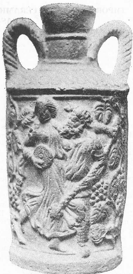
Fig. 1 b

nervures circulaires en relief et l'épaule représente, en totalité, une rosette à 23 pétales étroites. L'anse qui se conserve est décorée, à son tour, d'incisions obliques, ce qui lui donne en quelque sorte l'aspect d'une torsade.