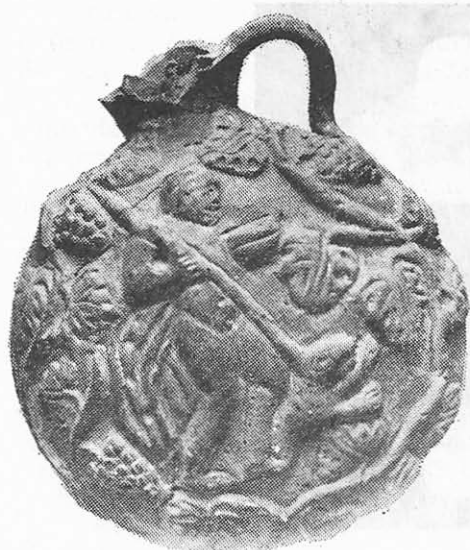
Fig. 2 a