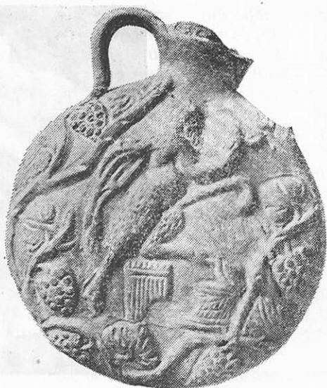
Fig. 2 b

Le récipient, inédit jusqu'à présent, a été exécuté toujours à l'aide des moules ; les deux parties ont été juxtaposées et ensuite collées.