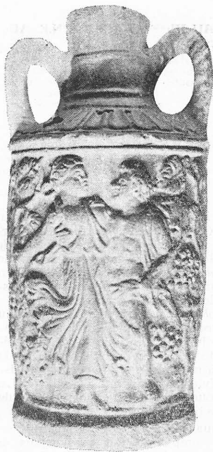
Fig. 1 a