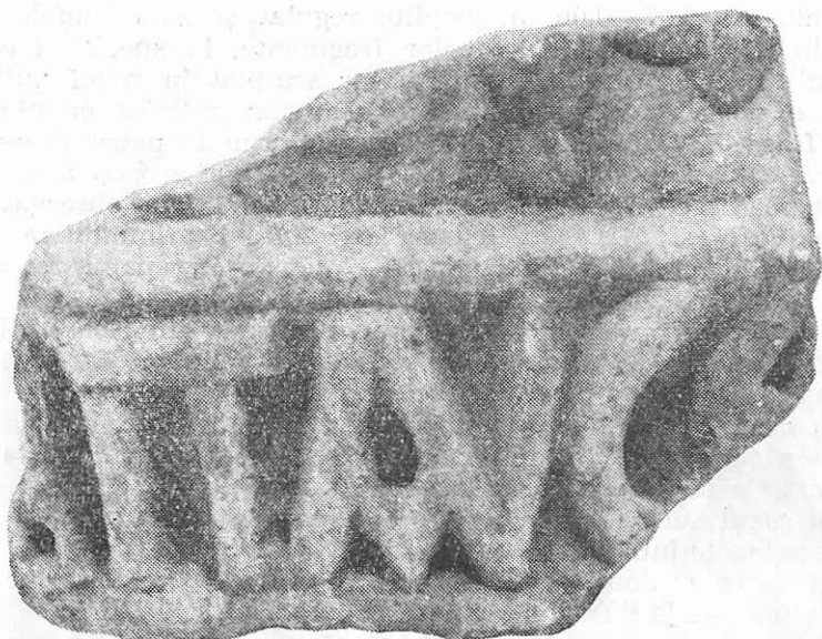
Fig. 4. Fragment dintr-un monument dăruit pentru „pomenirea și odihna” unui necunoscut.

gime, iar la extremitățile din stînga și din dreapta se distinge cite un rest din literele A și E.