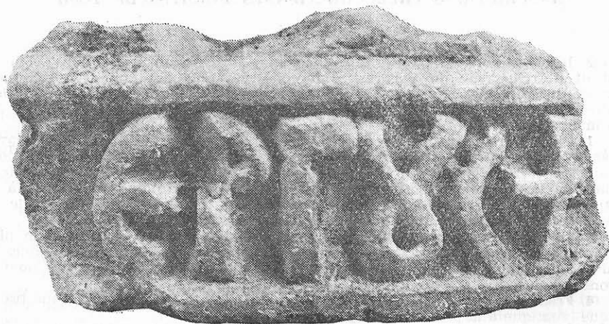
Fig. 5. Fragment dintr-un monument dăruit pentru „pomenirea și odihna“ lui Serghie

inscripție. Deosebirea constă în marmura fără vine albastrui și în numele propriu de la sfârșitul textului stereotip, în cazul de față singurul păstrat aproape întreg. Textul inscripției era foarte probabil următorul : [† Ὑπὲρ μνήμης καὶ ἀναπαύσεως Σ]έργου.