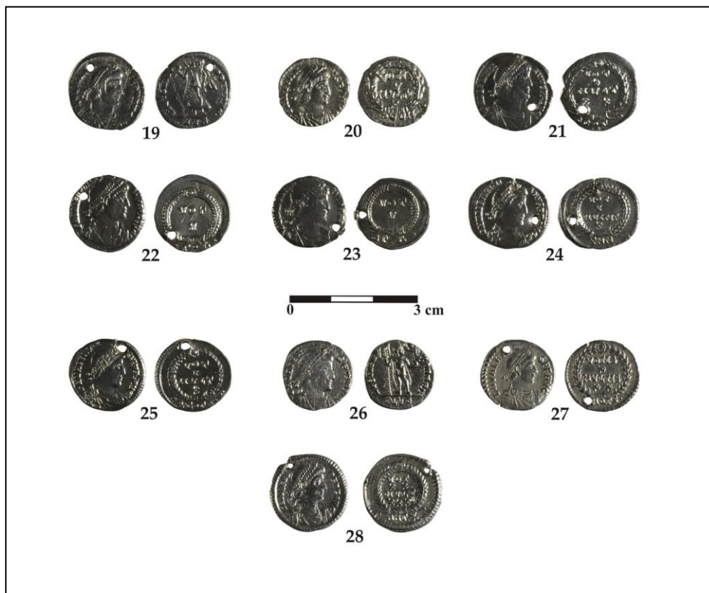
Pl. II - Monede de argint romane din secolul al IV-lea p.Chr. aflate în colecția numismatică veche a Muzeului Național Bruckenthal din Sibiu (cat. 19-28) / Roman silver coins from the 4 th century AD. located in the old numismatic collection of the Bruckenthal National Museum in Sibiu (cat. 19-28).