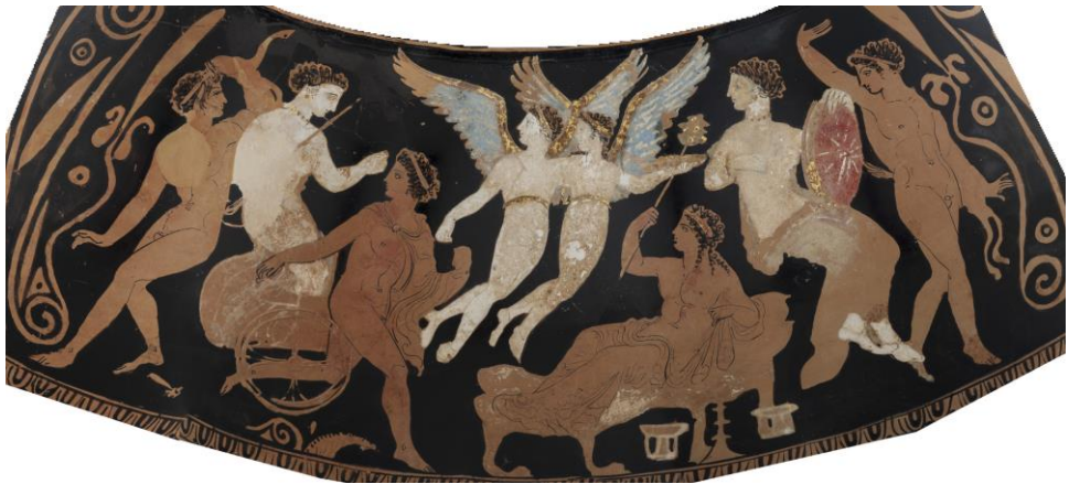
Fig. 4 - Détail du lécythe polychrome de la nécropole d'Apollonia du Pont (d'après T. Bogdanova, 2019, p. 160-161, cat. 147).