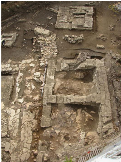
Fig. 2 - Temple et autel archaïques dans le sanctuaire de l'île de Saint-Cyriaque (d'après, M. Damyanov, D. Stoyanova, 2019, p. 57, fig. 1).