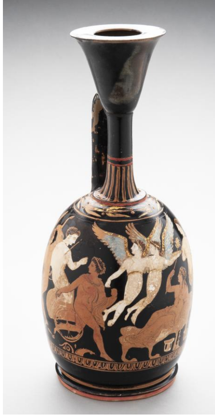
Fig. 3 - Lécythe polychrome de la nécropole d'Apollonia du Pont (d'après T. Bogdanova, 2019, p. 160-161, cat. 147).