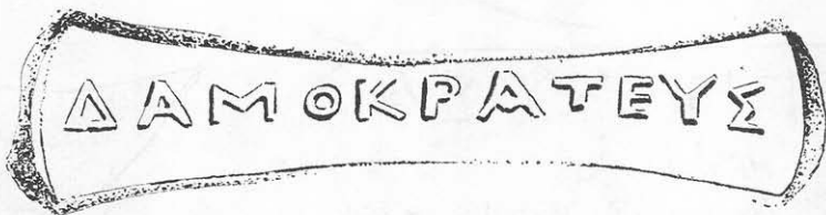
Toarta nr. 4.

Numele Δαμοκράτης apare în lista producătorilor rhodieni (la V. Canarache, nr. 515, 516, 517). Pentru această ștampilă, datarea e greu destabilit.