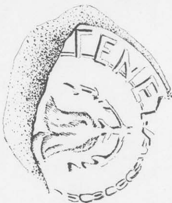
Toarta nr. 5.

Dat fiind floarea de rodie, simbol caracteristic, atribuim și această toartă unui atelier rhodian.