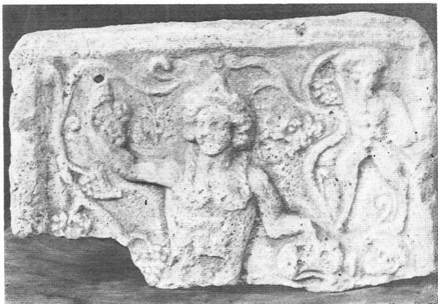
Abb. 1. Bacchisches Votivrelief. Hälfte des II. Jh.u.Z.