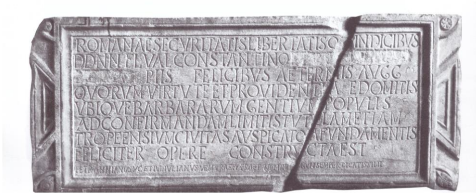
Fig. 1: apud ISM IV, 16, p. 434, pl. 16.

Romanae securitatis libertatisq(ue) vindicibus