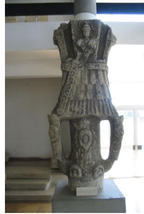
Fig. 2b:

Prin urmare, toate cele trei monumente – inscripția, poarta de est, trofeul – formează un mediu discursiv coerent (epigrafic, arhitectonic, artistic), a cărui finalitate este reprezentarea publică, deplin concordantă, a puterii diarhilor Constantin și Licinius și „publicitatea” 18 adecvată a semnificațiilor politice, militare și ideologice ale operei restitutive întreprinse de aceștia în provincia frontieră.