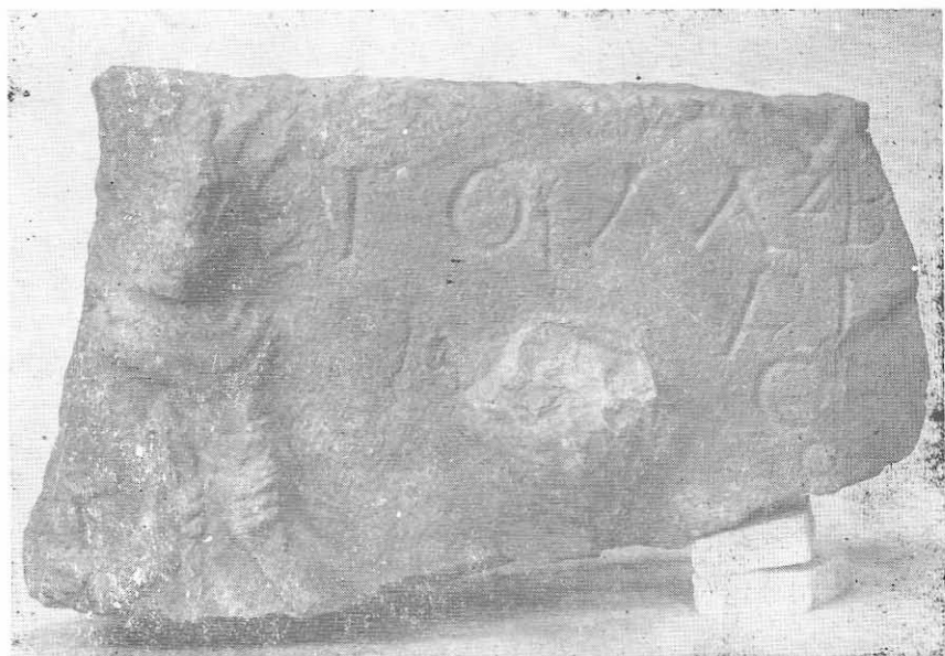
Fig. 2. DROBETA. Fragmentul „Tocilescu” cu Jupiter Zbelsurdos. Muzeul Olteniei din Craiova.