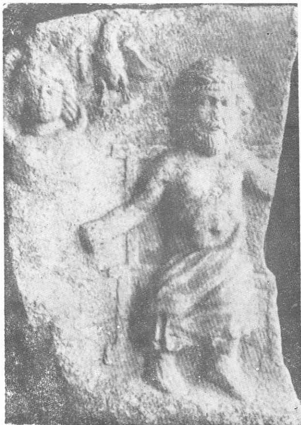
Fig. 1. DROBETA. „Fragmentul Pârvan“ cu Jupiter Sabazios (dispărut în 1918 din Muzeul „Porțile de Fier”).