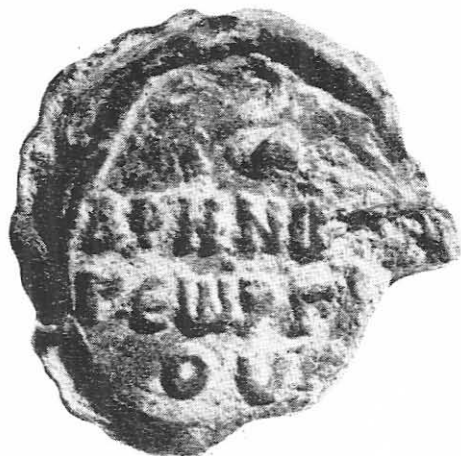
Taf 1 b