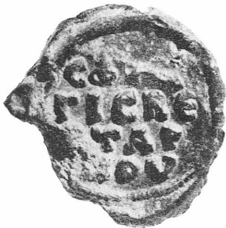
Taf 1 a