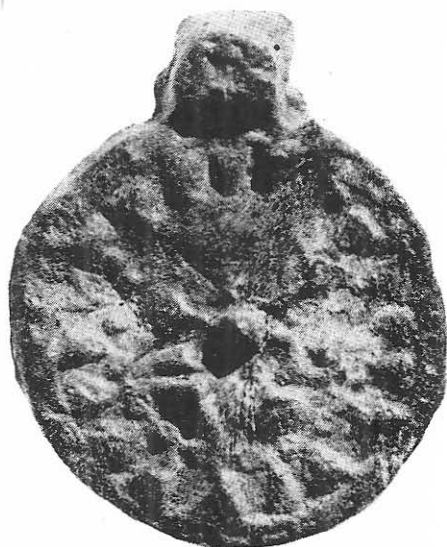
Taf 4 a