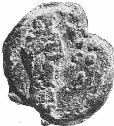
Taf 2 b