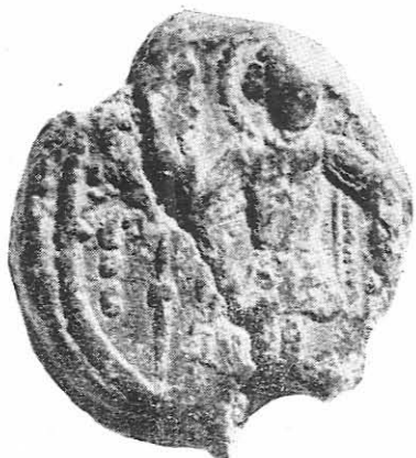
Taf 2 a