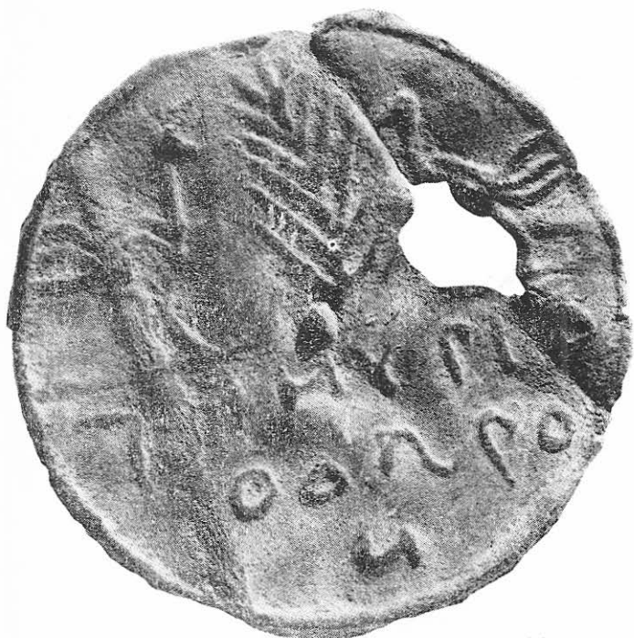
Taf 3 a