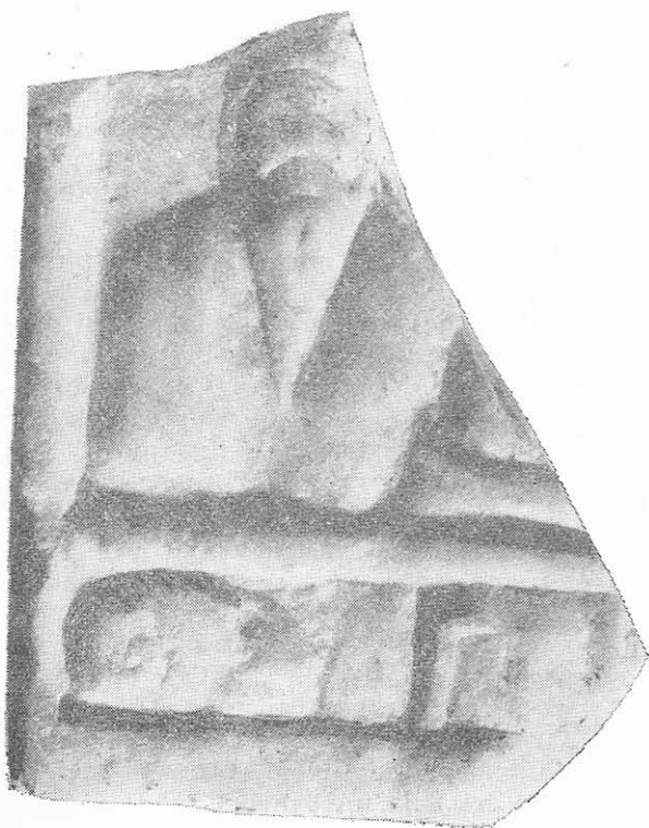
Fig. 4. Tomis. Fragment dintr-o tăbliță de marmură. Muzeul de arheologie Constanța.

vinităților. Asemenea elemente pe tăblițele danubiene apar iarăși numai în Dacia, la cele mai vechi reprezentări ale Cavalerilor danubieni, datate în secolul II e.n. cînd din punct de vedere iconografic, în această provincie, pentru prima dată și-a făcut apariția Cavalerul danubian nedublat 10 . Se constată de asemenea că atunci cînd în secolul al III-lea