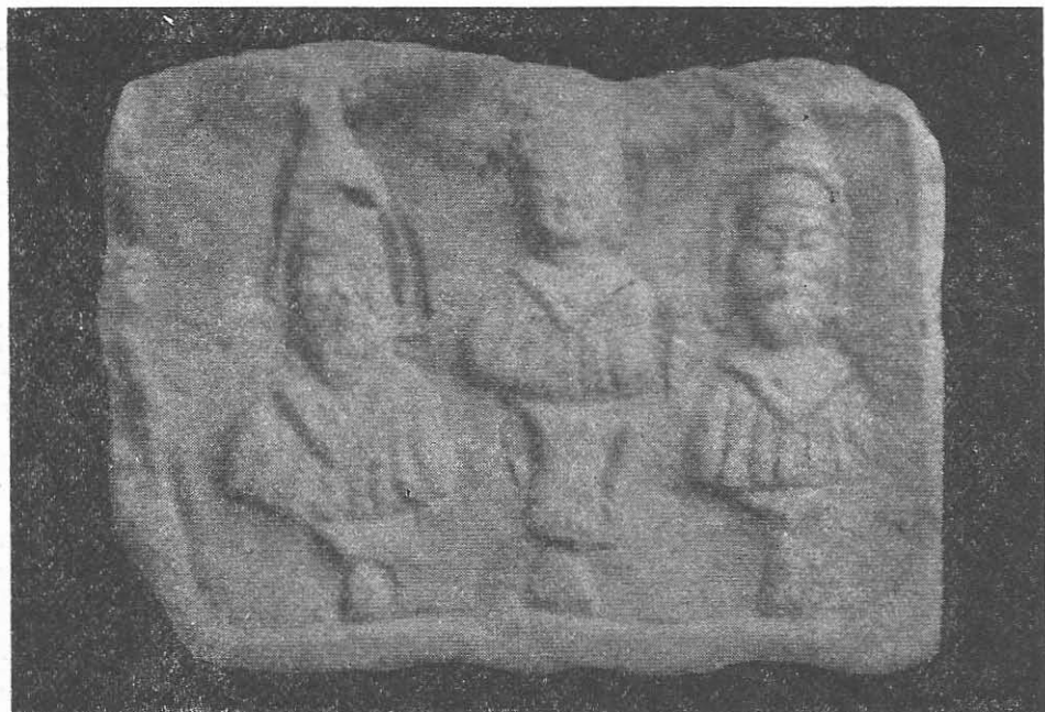
Fig. 3. Corbul de Jos. Relief din piatră. Muzeul de arheologie Constanța.

În primul rînd, apariția neașteptată a acestor patru tipuri de reliefuri numai pe teritoriul Dobrogei a determinat stabilirea unei noi