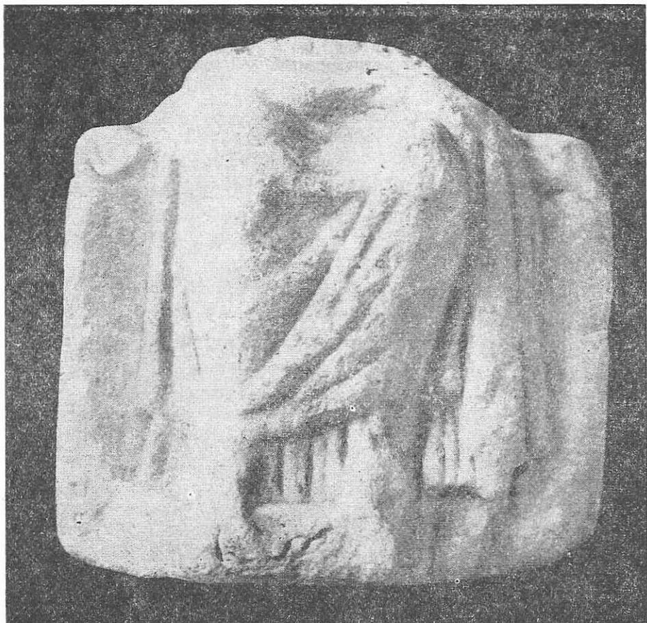
Fig. 2. Cybela. Mangalia. Epoca elenistică.

Cybela este așezată pe tron. Poartă chiton și himation care sînt mult drapate. Un voal coboară de pe umărul drept, trece peste genunchi și alunecă pe lingă piciorul stîng al zeiței.