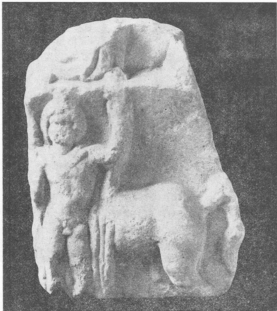
Fig. 4. Dioscuri. Constanța. Sec. II—III e.n.

de acest veșmînt, presupunem că divinitatea era reprezentată așezată pe un tron.