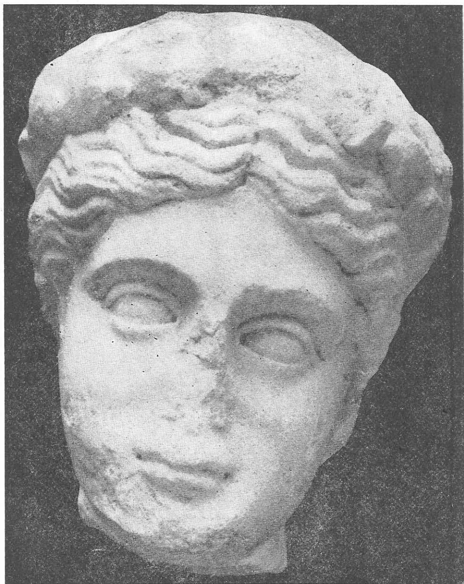
Fig.1. Apollo. Constanța. Sec. I—II c.n.