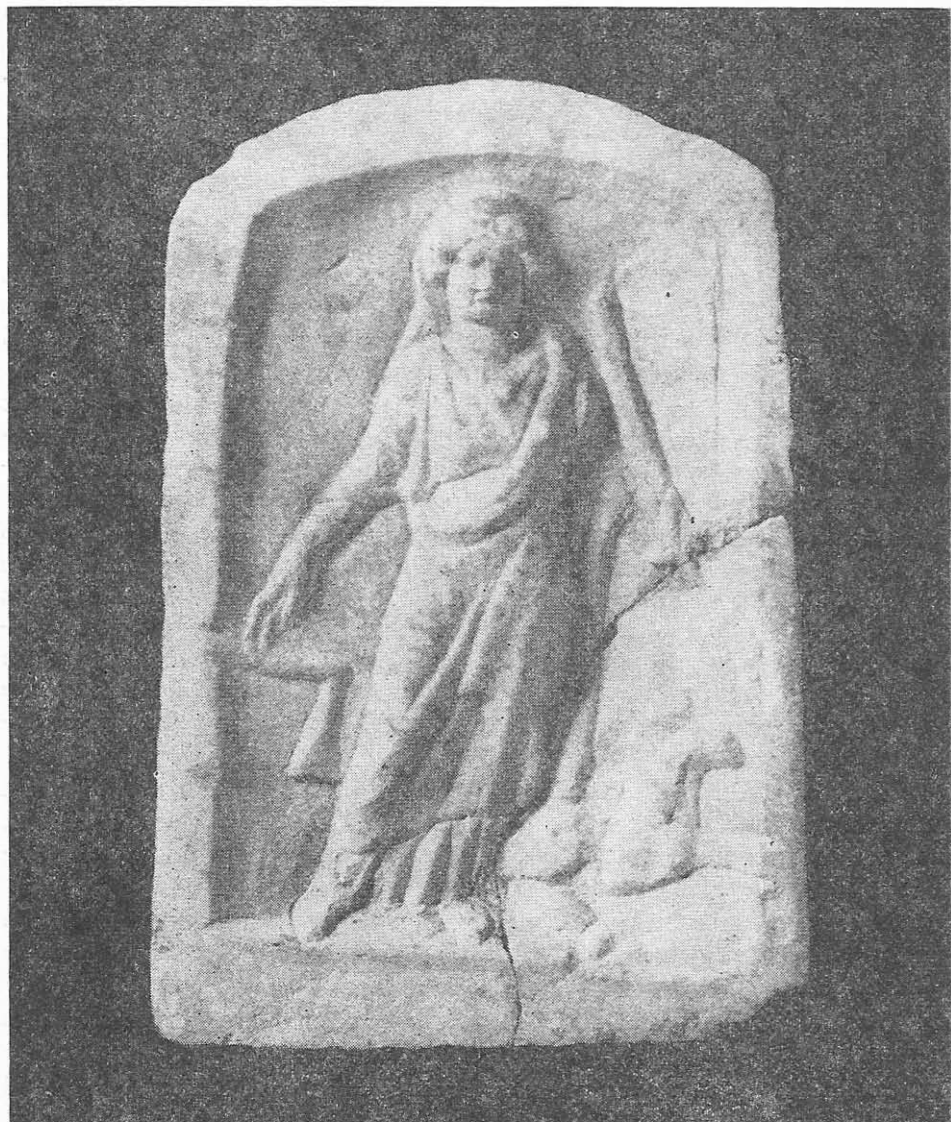
Fig. 5. Nemesis. Constanța. Sec. III e.n.

6. Cavalerul Trac (fig. 6). Constanța 24 . Inv. 17559. În. 0,240 m, lăț. 0,210 m, gros. 0,090 m. Basorelieful este lucrat din marmoră albă. Relieful este încadrat de un chenar mai lat la bază și subțiat pe celelalte laturi.