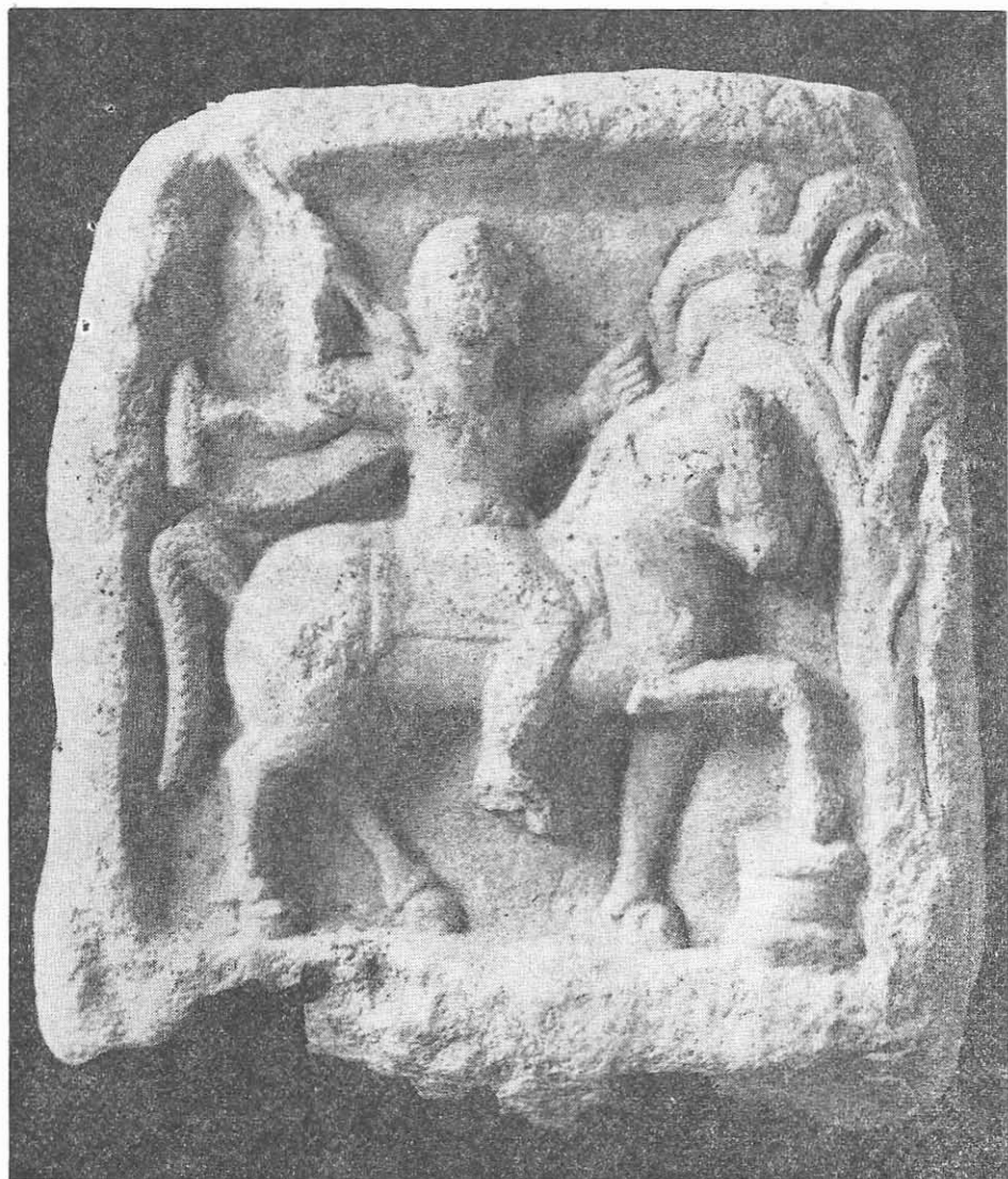
Fig. 6. Cavalerul Trac. Constanța. Sec. II—III e.n.

Scena prezintă pe Cavalerul Trac mergînd cu calul spre dreapta. Divinitatea este prezentată cu figura și torsul din față, iar piciorul drept din profil. Corpul este înveșmîntat într-o tunică scurtă, iar hlamida, prinsă în față cu o agrafă și trecută peste umeri, flutură în vînt. În mîna dreaptă, ridicată deasupra capului, Eroul ține o suliță scurtă. Cu mîna stîngă ridicată la înălțimea umărului, Cavalerul trage friul, întorcînd capul calului puțin spre dreapta.