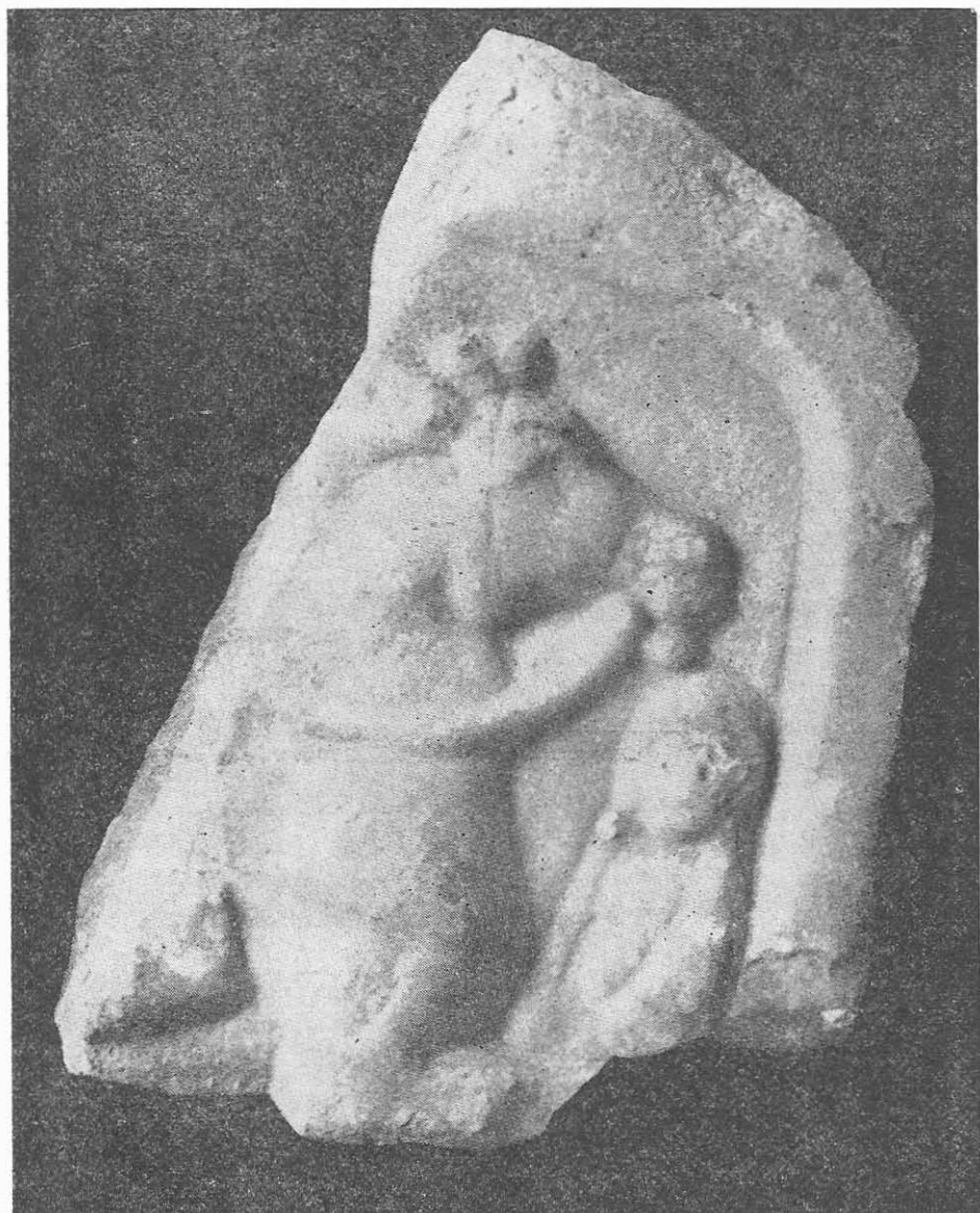
Fig. 7. Cavalerul Trac. Col. Slobozianu. Sec. II—III e.n.

Calul ține piciorul drept din față pe un altar rotund cu baza și partea superioară puțin profilate. Coama, deasă și scurtă, este redată prin linii incizate succesive. În același mod este realizată și coada lungă, puțin ridicată. Picioarele calului au fost lucrate bine, aproape perfect.