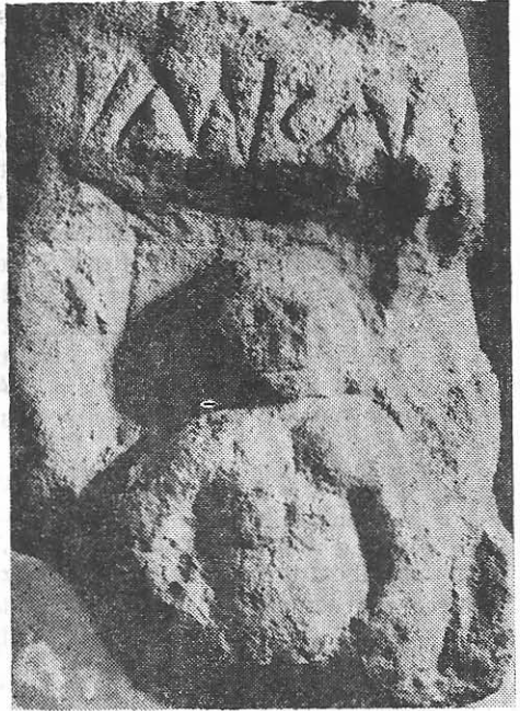
Fig. 4. Ex-voto din calcar, Heracles. Sf. sec. III-inceputul sec. IV e.n. Bugeac.

poziția pe care o au miinile, deducem că pe antebrațul stîng purta pielea leului, iar cu mîna dreaptă — ușor depărtată de corp — sprijinea măciuca. Este tipul cel mai răspîndit în reprezentările plastice ale eroului. O analogie perfectă pentru maniera de prezentare ne este oferită de imaginea lui Hercule de pe un monument funerar descoperit la Potaissa 10 .