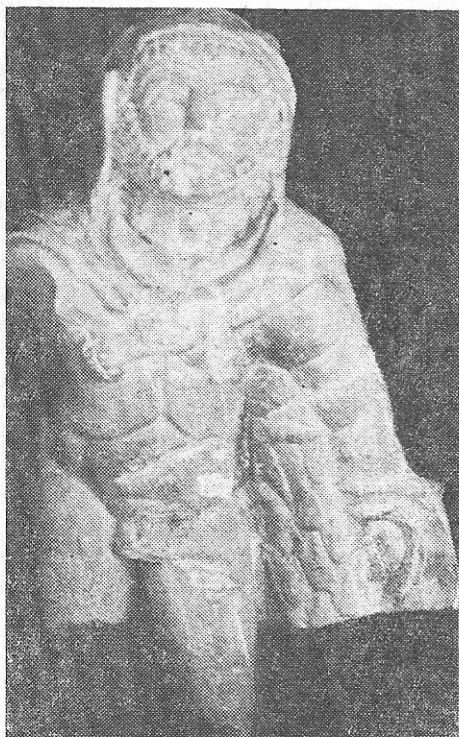
Fig. 1. Hercules. Statuetă din calcar, sf. sec. II e.n. Tîrgușor.

Sintem în fața unei reprezentări a lui Hercules de tipul Farnese , într-o variantă stilistică deosebită. Eroul este reprezentat nud, sprijinindu-se într-o măciucă masivă, noduroasă, cu greutatea corpului pe piciorul drept, piciorul stîng fiind ținut puțin mai în față. Exuvia leonis îi acoperă capul și umerii ; labele din față ale acesteia sînt înodate peste pieptul eroului, în timp ce partea de la coadă este strînsă și înfășurată pe antebrațul stîng. Pentru a evidenția musculatura eroului, sculptorul utilizează o serie de linii incizate sau profilate. Astfel, pe piept este realizată o incizie mediană ce se ramifică, arcuindu-se la baza toracelui, în timp ce la partea superioară trunchiul este în relief față de gît. Astfel marcată cutia toracică are aspectul de vestă. Gîtul gros,