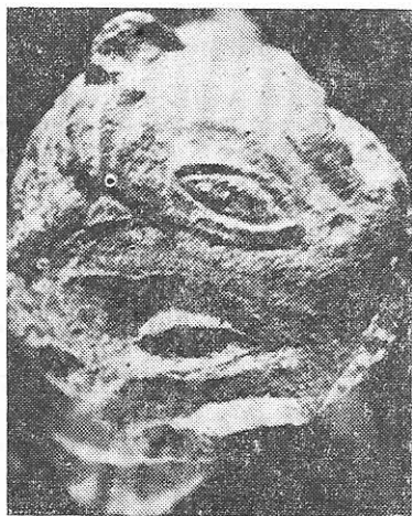
Fig. 2. Detaliu : exuvia leonis privită de sus.

În ansamblu, lucrarea este executată cu acuratețe, bine proporționată, acordîndu-se o atenție deosebită detaliilor. Trăsăturile particulare ale acestei sculpturi sînt o dovadă în plus în demonstrarea caracterului artei în Dobrogea romană.