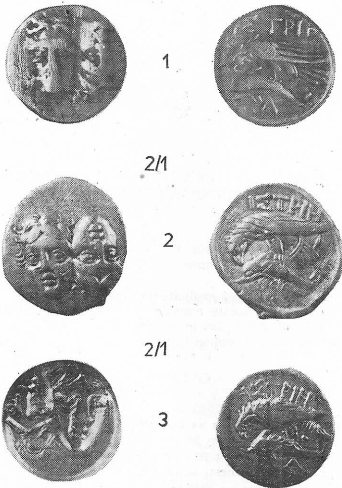
Planșa I. Drachme histriene descoperite recent în Dobrogea

Rv. ΙΣΤΡΙΗ ; vultur pe delfin spre stînga ; între aripile și coada vulturului sigla I.