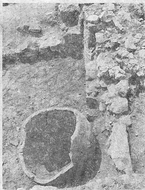
Fig. 4. Colțul de nord-est al încăperii din DC5.

Moneda descoperită în sondajul stratigrafic prezentat relevă și un alt aspect important din viața economică a așezării tropaeenilor din sec. al III-lea. Ea vine să completeze imaginea schimburilor economice pe care locuitorii de aici le realizau cu orașele grecești din sud 13 .