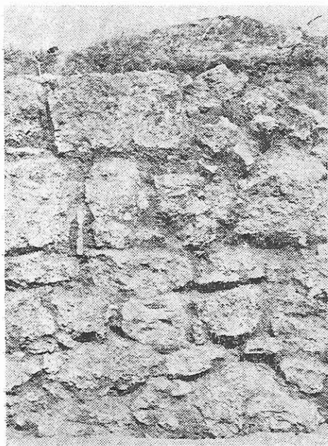
Fig. 3. Zid de sec. IV e.n.