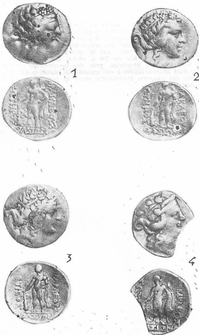
Plansa II. Tetrurahmele thasiene descoperite la Ulmu.