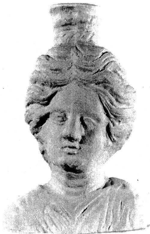
Fig. 1. b Copia fragmentului de tipar.

din epoca homerică 13 fără însă a fi definită. Cu timpul, în lumea ionică, Nemesis va căpăta o consistență tot mai precisă 14 . Astfel, la Smyrna , încă din secolul III a. Chr. i se făceau sanctuare, iar în secolul IV a. Chr. i se ridicau chiar statui. Tot acum, legat de evenimentele întâmplare în timpul campaniilor lui Alexandru cel Mare în Orient, după legendă, apare pe monede, pentru prima dată aici, imaginea celor două Nemesis geminate: una, cea a vechii și alta, cea a noii Smyrna 15 . Deși dominant în epoca elenistică, cultul ei nu se va răspândi în Imperiu decât foarte târziu, generalizându-se abia în secolele II-III p. Chr., când va însuma o seamă de atribute întâlnite și la alte divinități 15 .