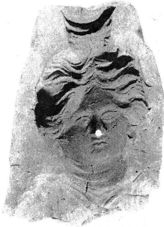
Fig. 1. a Fragment dintr-un tipar reprezentând pe zeița Isis.

de altfel, perioada în care se încadrează cuptoarele pentru ars oale 10 din marele centru ceramic de la Micăsasa.