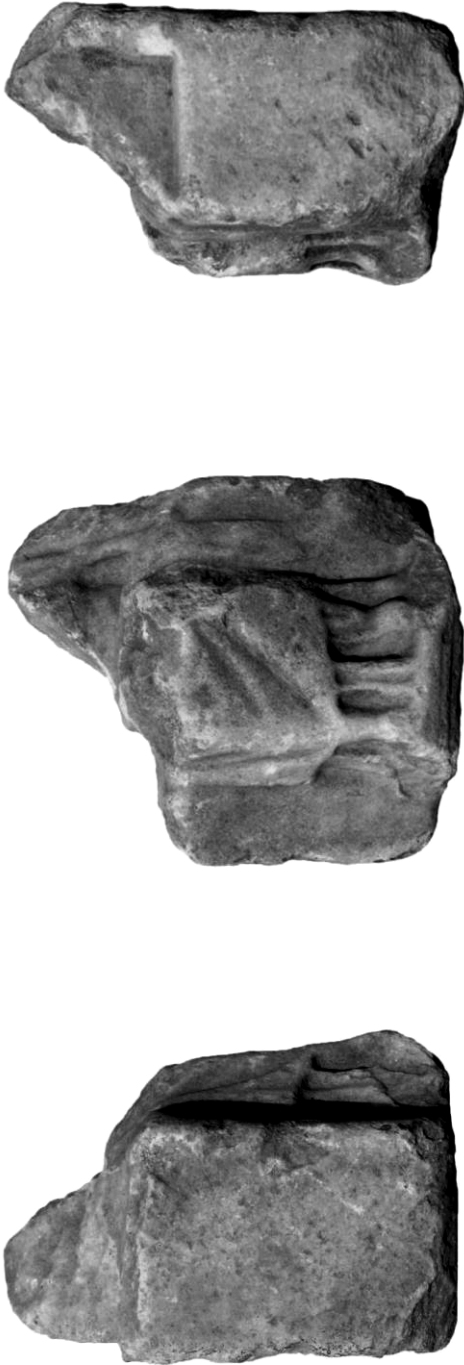
Fig. 2 - Statuetă cu reprezentarea zeiței Meter Theon șezând, marmură, nr. inv. His 2008 T [5] / Statuette of Meter Theon , marble, inv. no. His 2008 T [5].