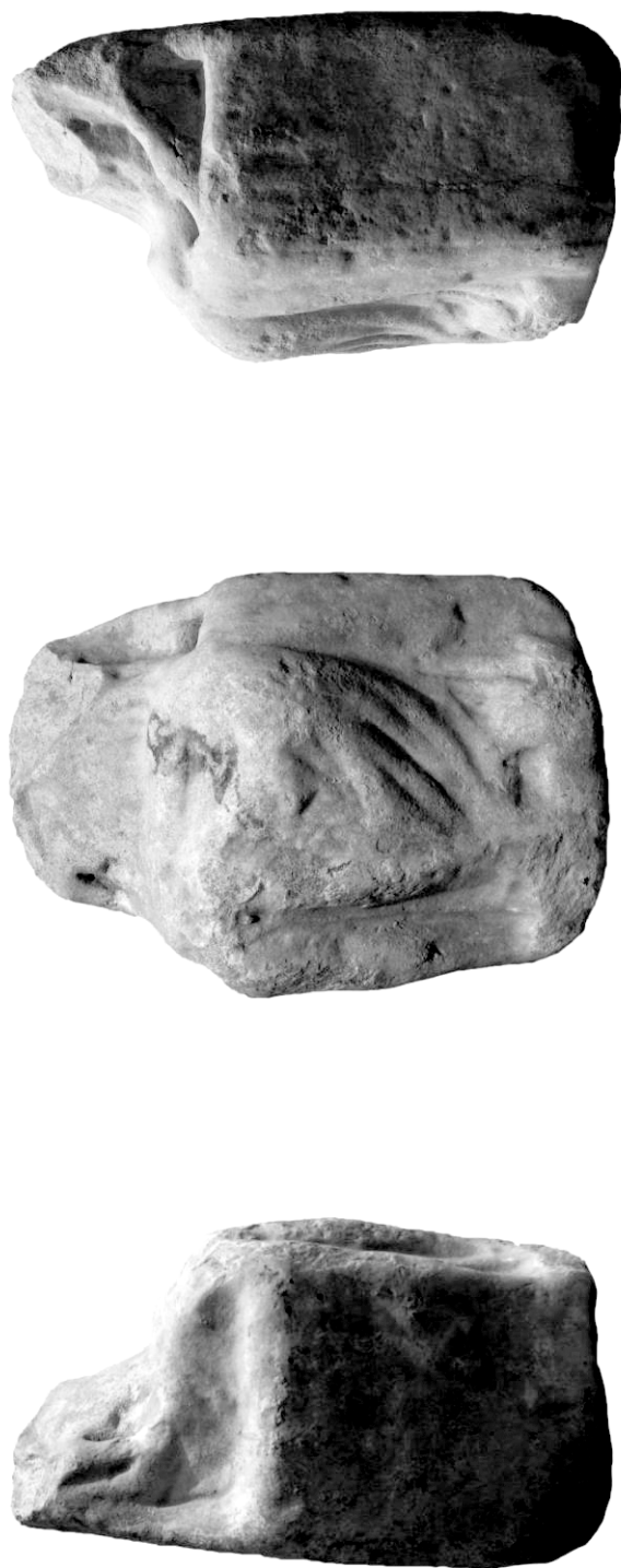
Fig. 1 - Statuetă cu reprezentarea zeiței Meter Theon șezând, marmură, nr. inv. His 1991 T [2]; / Statuette of Meter Theon , marble, inv. no. His 1991 T [2].