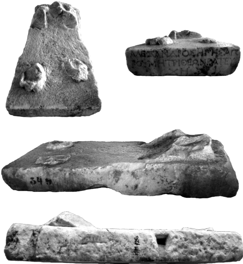
Fig. 5 - Plinta statuii unui leu, dedicată zeiței Meter Theon , marmură, ISM I 126 / Plinth statue of a lion, dedicated to Meter Theon , marble, ISM I 126.