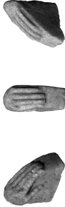
Fig. 3 - Fragment de tympanon , marmură, nr. inv. His 2008 T [6] / Fragment of a tympanum , marble, inv. no. His 2008 T [6].