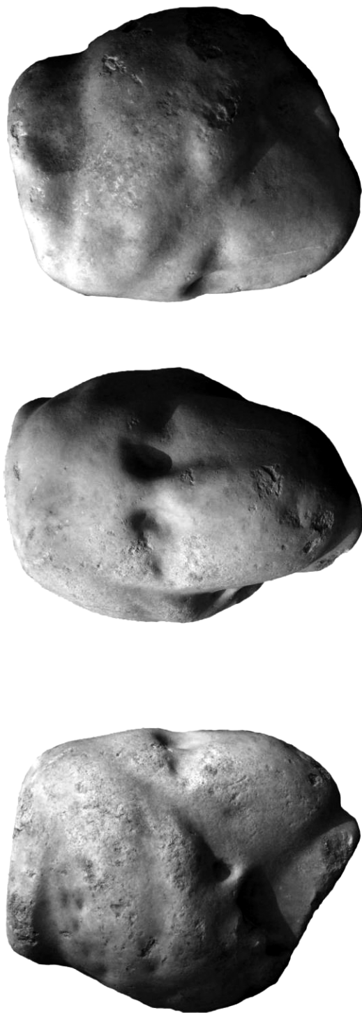
Fig. 4 - Cap de femeie purtând polos , marmură, nr. inv. His 2000 T [1] / Female head wearing polos , marble, inv. no. His 2000 T [1].